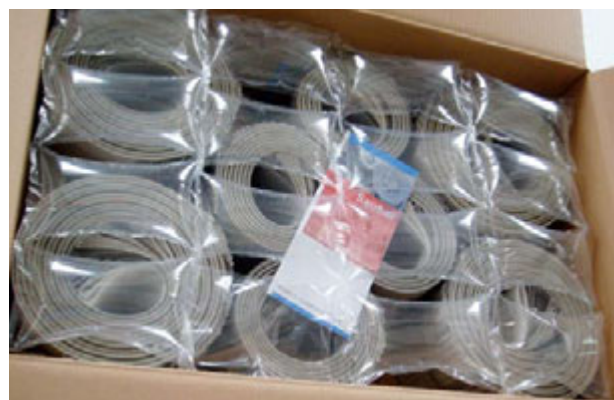
Sicher verpackt – wichtig bei hochwertigem Sonnenschutz!

Dank Kondensverfahren trocknet das komplette Reinigungsgut des Vortags über Nacht sicher aus